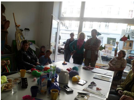
Aufgeschlossene & fröhliche BesucherInnen