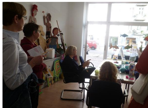
Schaulustige und MitmacherInnen sind da