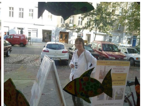
Ausgestattet mit Werbeflyer