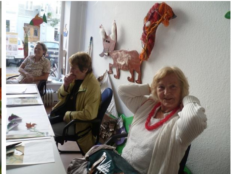
Die VipLounge lädt zum Verweilen ein.