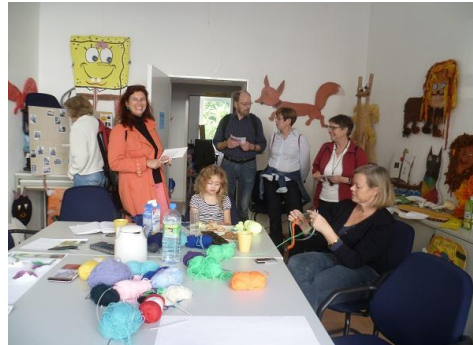
Auch das Modell der Kreuzung interessiert