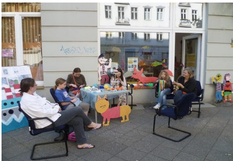
Am Sonntag Freiluftstricken und Häkeln