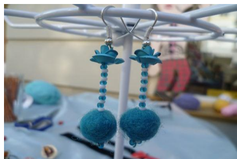
Ansehenswerte Strickobjekte sind das Ergebnis