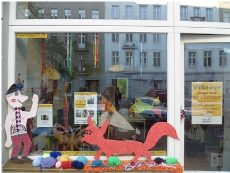
Einladend präsentiert sich die VipLounge